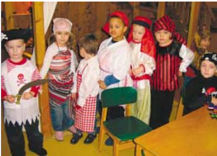
Fasching macht Spass und im Kindergarten waren die Kleinen bis Faschingsdienstag abenteuerlich verkleidet.

Die Kinder haben in den letzten Wochen 4 Projektwochen erlebt. Sie lernten 4 verschiedene Länder durch Musik,