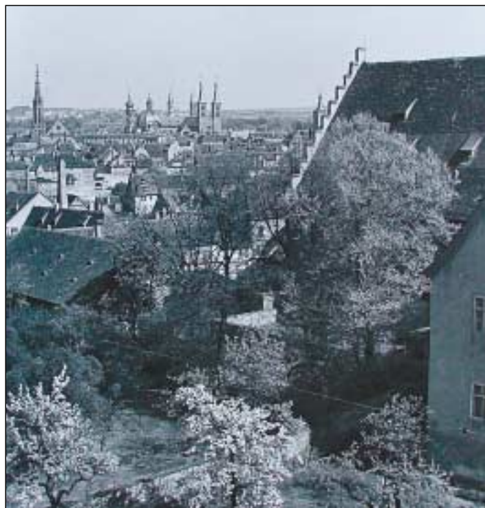
Rechts der Treppengiebel des mittelalterlichen Kornspeichers und der späteren Koopschen Gießerei